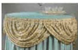
B u f f e t s